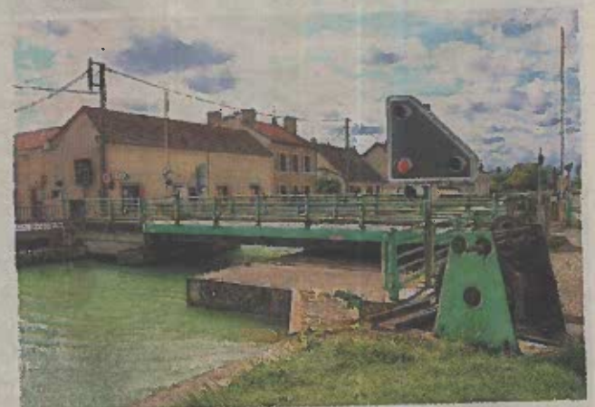
Le chantier du pont de Bisseuil durera jusqu'en décembre.