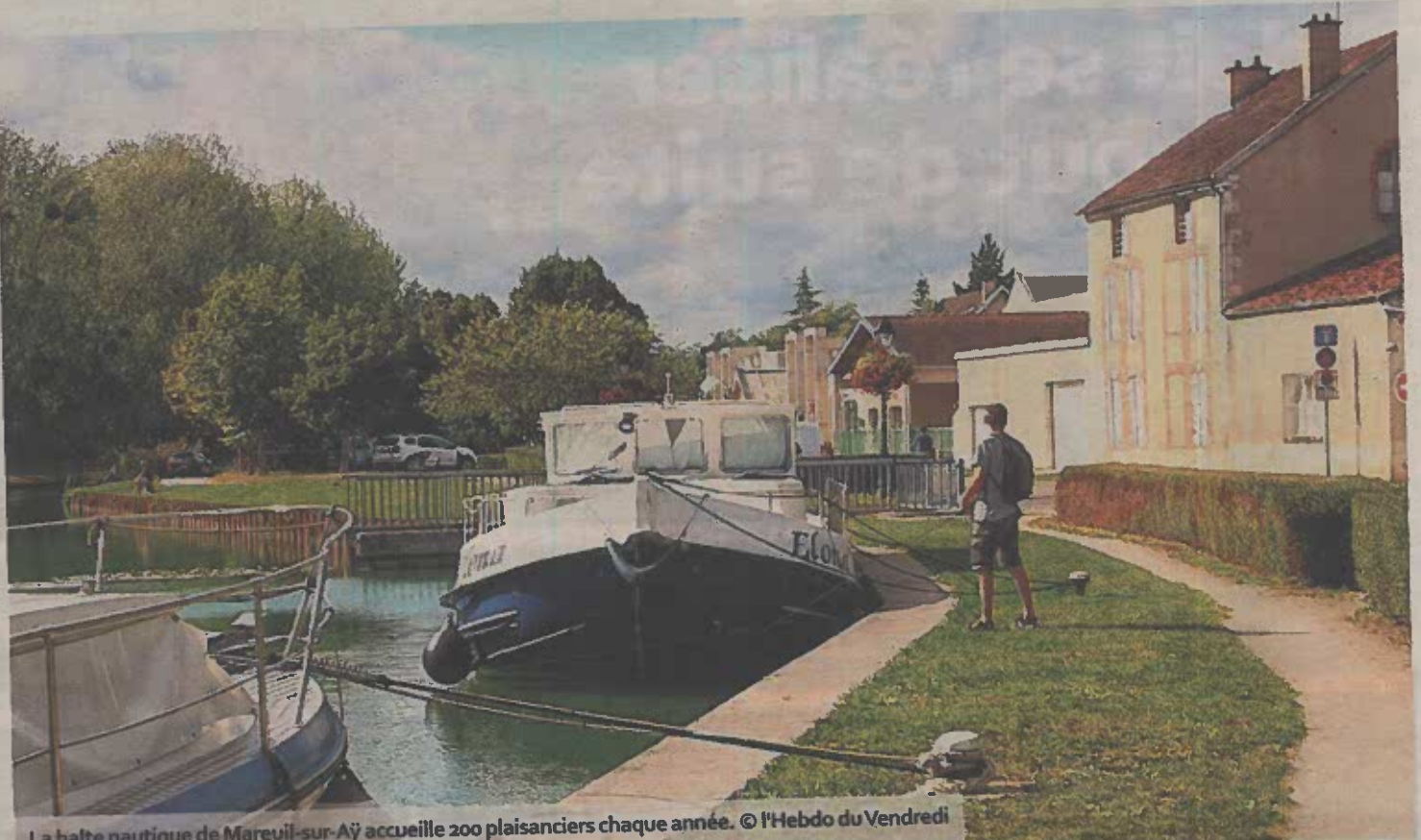
La halte nautique de Mareuil-sur-Aÿ accueille 200 plaisanciers chaque année.

C'est d'abord la capitainerie qui a subi les premiers coups de pioche, dès cet été. Deux douches adaptées aux personnes à mobilité réduite ont été renouvelées tandis que la réfection de la toiture est en cours. Puis, le chantier a démarré, il y a quelques jours, du côté de l'aire de camping-car. « Elle datait, elle aussi, du début des années 90, elle sera entièrement refaite et modernisée », poursuit l'employé intercommunal. Le site comportera sept places et une aire de service (vidanges, eaux, poubelles...). Treize arbres ont dû être coupés pour dégager de l'espace. « D'autres seront replantés et il y aura un nouvel aménagement paysager », promet Rémi Lefèvre, conscient que le sujet est bien souvent sensible. Enfin, le ponton, doté de quinze places, sera prochainement sorti de l'eau, vraisemblablement à partir de la semaine prochaine, et un ouvrage neuf